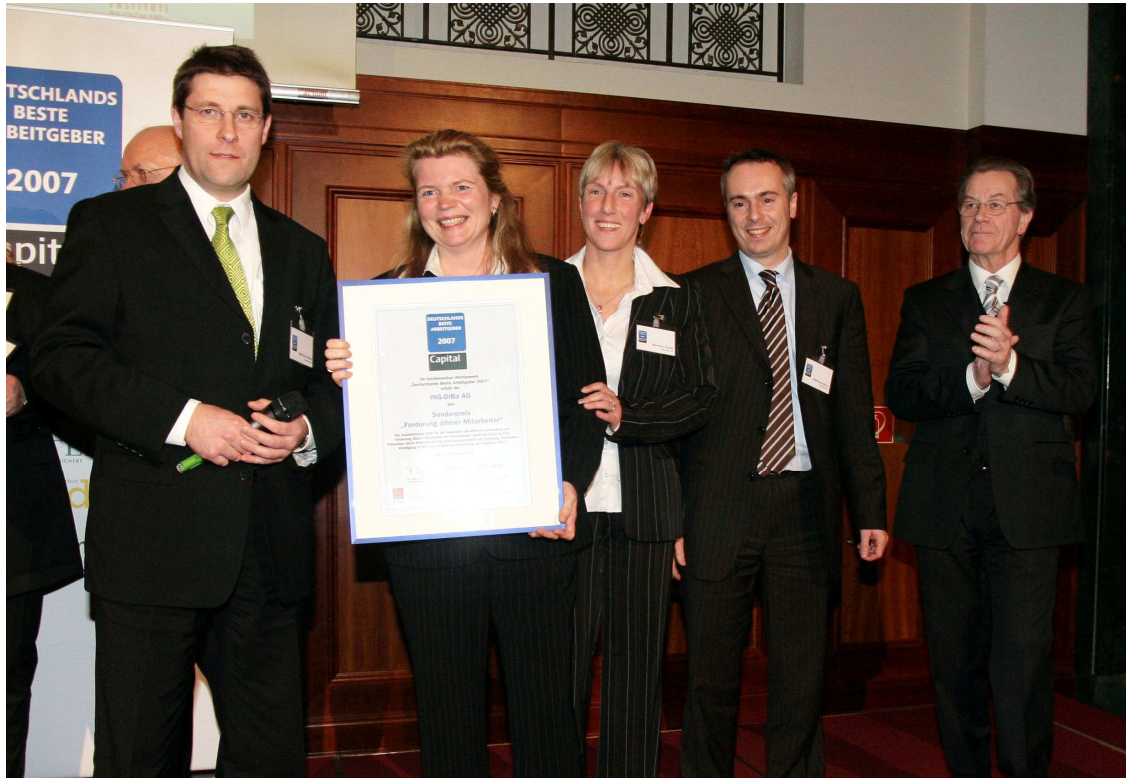
Die ING-DiBa zählt zu den 50 besten Arbeitgebern Deutschlands