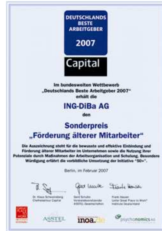
Sonderpreis für die Förderung älterer Mitarbeiter