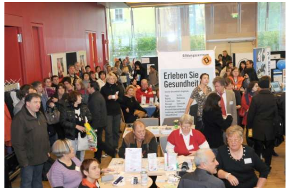
300 Besucherinnen und Besucher informierten sich am Gesundheitstag der ARGE Nürnberg und dem Pakt50 rund ums Thema Gesundheitsfürsorge und Prävention.